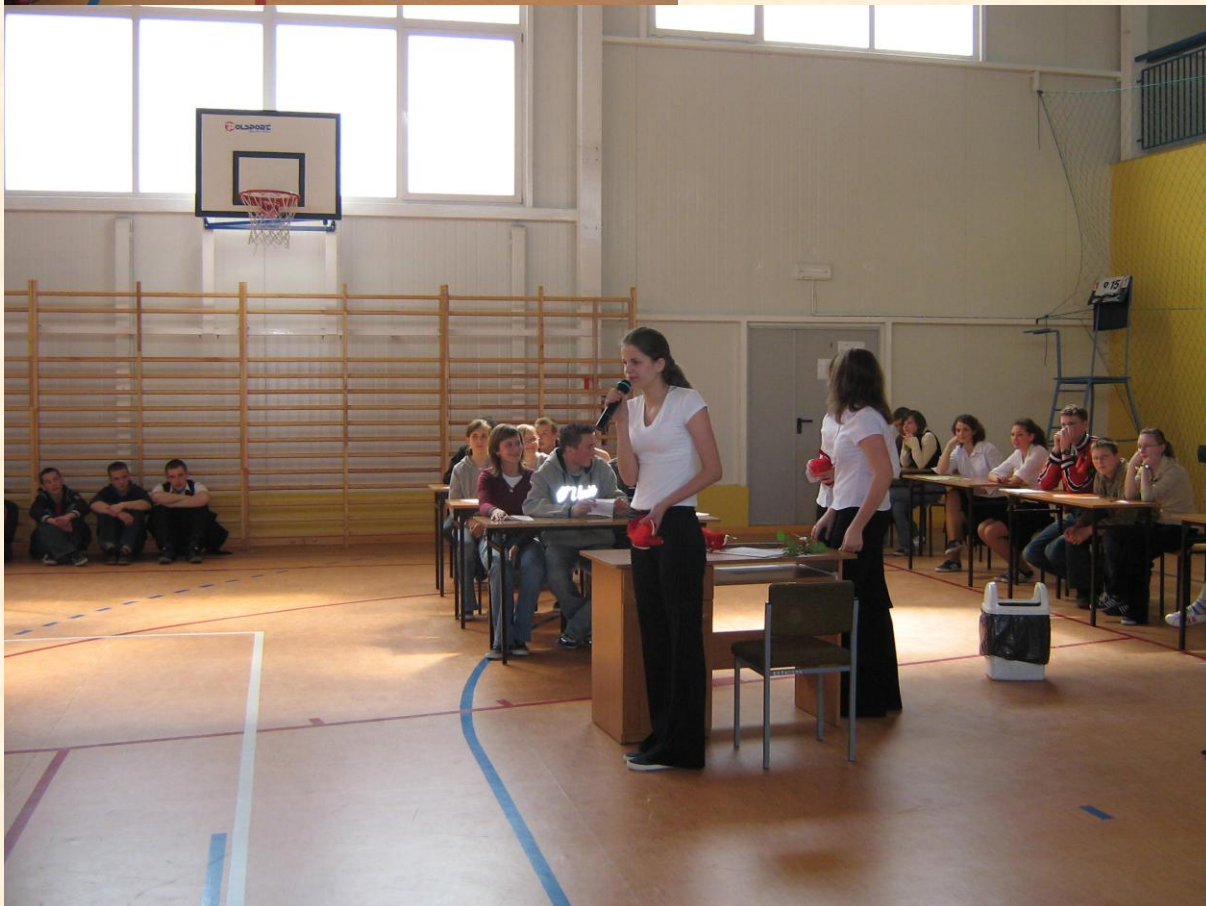
Przedstawiciele Zarządu SU