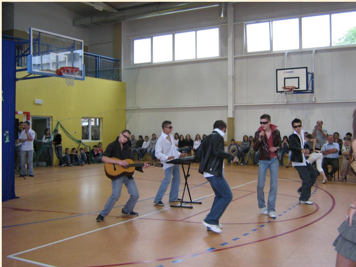
Koledzy z klasy II d podziwiani przez uczniów, rodziców i nauczycieli

Zainteresowanie wzbudziły prezentacje znanych przebojów w wykonaniu uczniów.