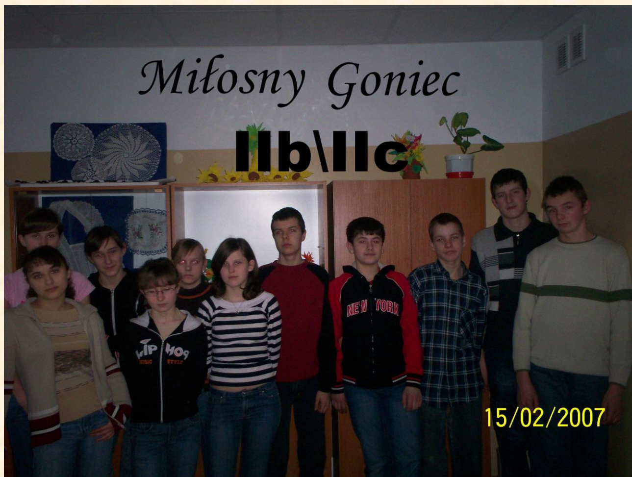
Organizatorzy poczty walentynkowej