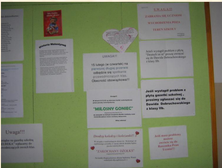
Z gazetki ściennej SU

Po raz pierwszy w historii naszego gimnazjum działały dwie poczty walentynkowe. Organizatorami dnia św. Walentego byli koledzy i koleżanki z klas drugich. Nad całością imprezy czuwał zarząd samorządu uczniowskiego. Walentynki dostarczyły gimnazjalistom i pracownikom szkoły wielu miłych wrażeń