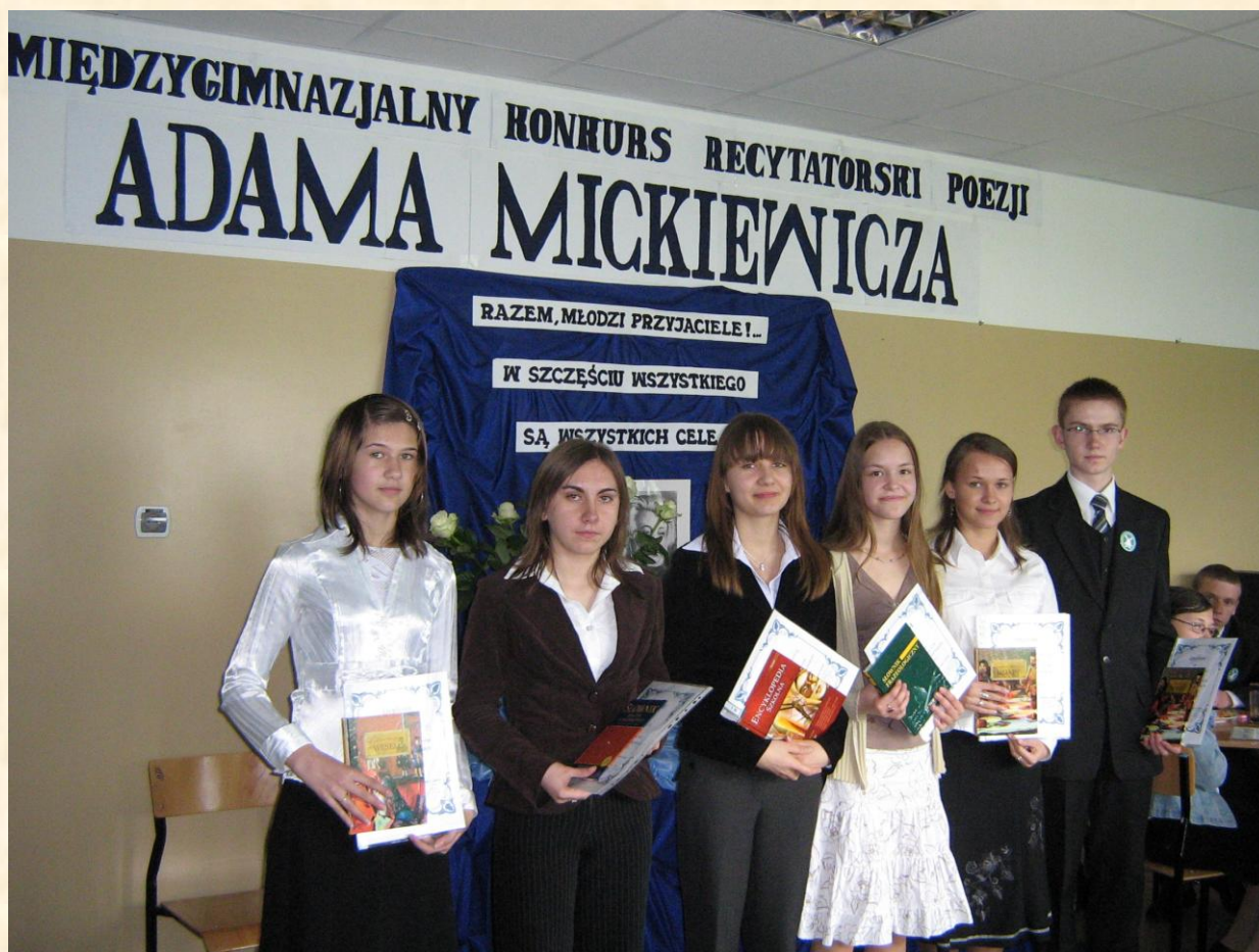
Laureaci III edycji konkursu

Jury przyznało nagrody następującym uczestnikom: