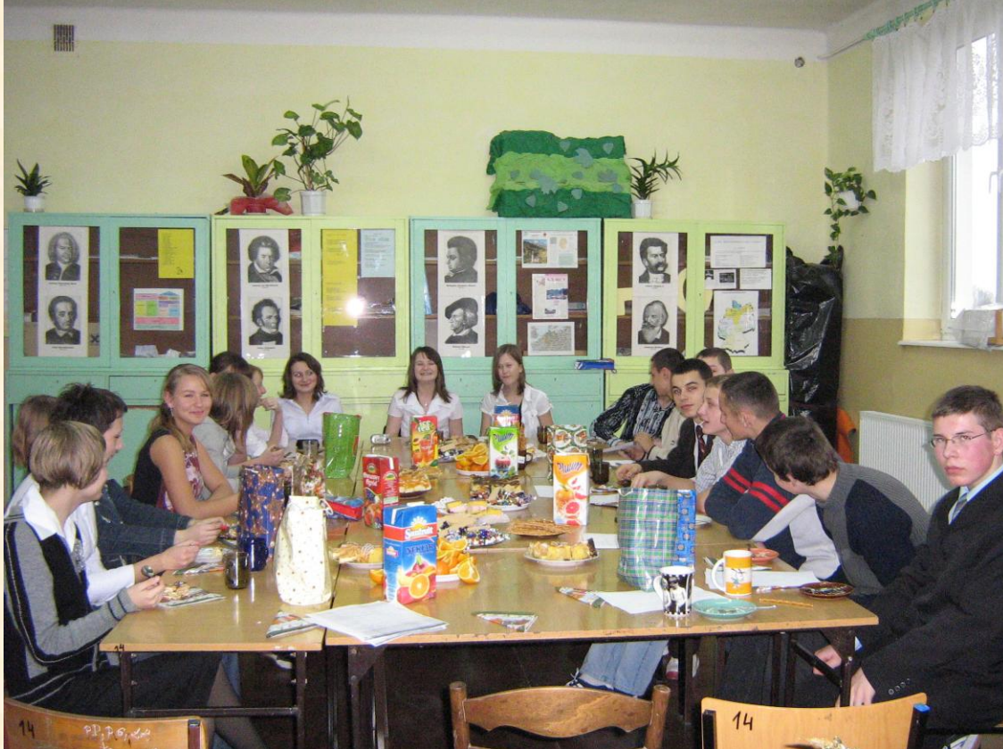
Uczniowie klasy III d